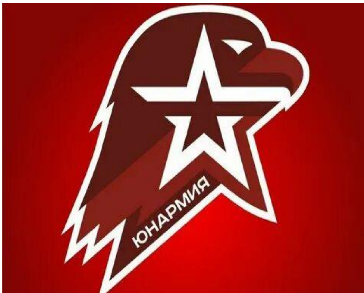
Эмблема "Юнармии" России