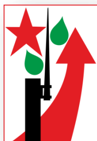
Эмблема игры "Зарница" 1970 года

С этого учебного года в нашей школе сформирован юнармейский отряд Всероссийского детско-юношеского военно-патриотического общественного движения «Юнармия». В отряде 24 учащихся из шестых классов. Что же представляет собой юнармейское движение? «Юнармия» - это добровольное российское детско-юношеское движение, которое возродило добрые традиции молодежных организаций. С момента своего создания в 2016 году оно объединило более миллиона детей и подростков России. Каждому участнику движения открывается доступ к сотням увлекательных событий, патриотических акций, конкурсов, возможности изучать технику и заниматься спортом, посещать детские центры и лагеря. Вступить в «Юнарию» может любой желающий от 8 до 18 лет.